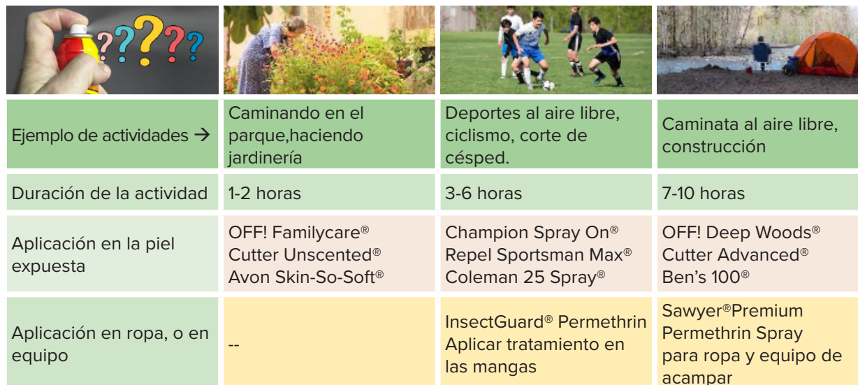
Tabla 1. *Ejemplos de productos repelentes aptos para diferentes propósitos.

No todos los productos se pueden utilizar en niños.