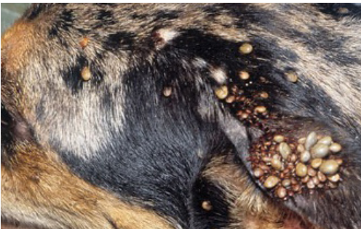
Las garrapatas del perro se pueden encontrar alimentándose en grupos.

Las garrapatas marrones del perro pueden completar su ciclo de vida dentro de las casas o al aire libre, y están activas al aire libre durante los meses cálidos.