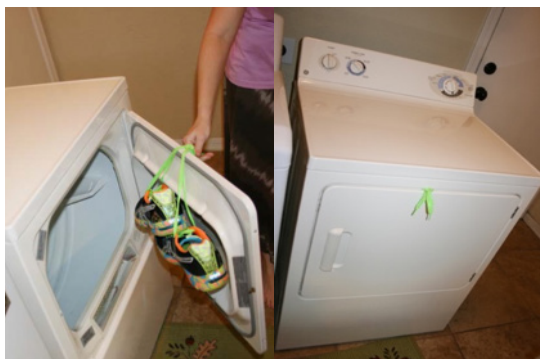
Fig. 3. Tratamiento térmico para zapatos en una secadora casera.