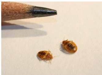
Fig. 1. Chinches junto a un lápiz como punto de comparación.

Las chinches son pequeños insectos planos de color marrón rojizo (Fig. 1), que se alimentan de la sangre humana. Las chinches no transmiten patógenos que causan enfermedades. Las chinches adultas miden alrededor de un ¼ de pulgada de largo con una forma ovalada plana y son aproximadamente del tamaño de una semilla de manzana. No saltan ni vuelan, pero pueden arrastrarse rápidamente. Las chinches generalmente se alimentan por la noche y durante el día se esconden en grietas y hendiduras cerca de los lugares de descanso.